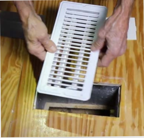
တၢ်လၢဘၣ်မၤ - မၤတံၢ်ယးတၢ်ကမ့ၢ်ဖျိးထီၣ်ကလံၤကျိၣ်