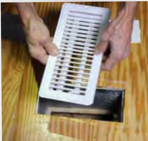
Por hacerse: Sellar los conductos de aire para evitar la filtración